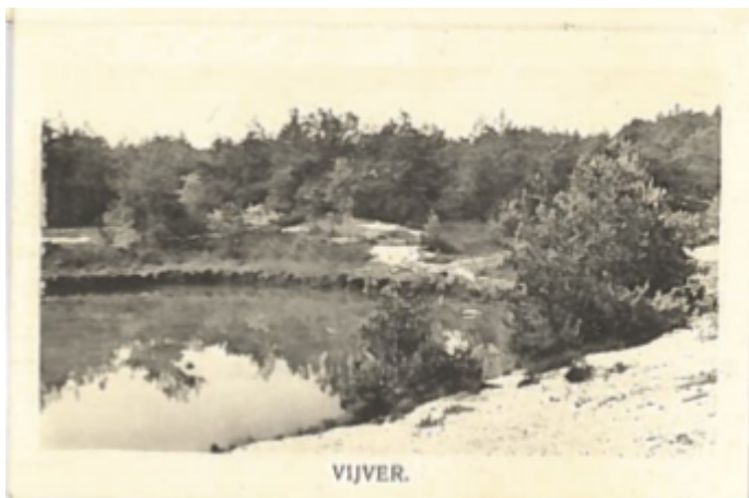
Oude foto spartel-zwemvijver

W10. Dit was vroeger de spartel-zwemvijver van Landgoed Ginkelduin en rondom lag een breed zandstrand. Nu zwemmen er kikkers, salamanders en ringslangen in. De ringslang is leigrijs van kleur en NIET GIFTIG maar wél een meter lang. Ook is het de drinkplaats van de vos, de das en natuurlijk vele soorten vogels. Met warm weer zie je er libellen en andere insecten boven het water.